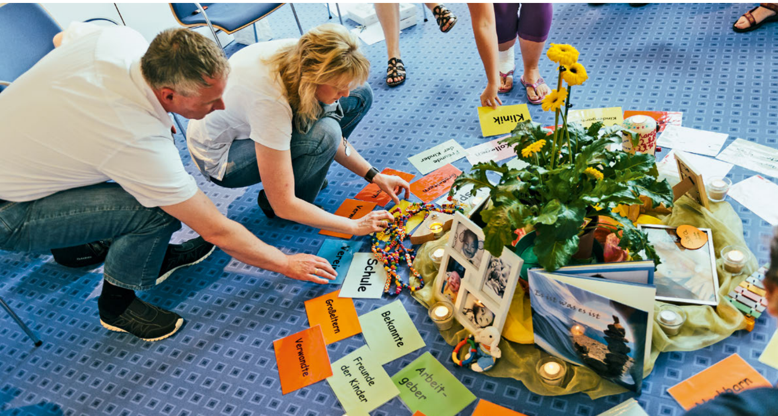
Eltern formulieren im Rahmen der Gruppentherapie, wer ihnen in ihrer Trauer zur Seite steht.

beseitigt werden. Diese eher zwanglose Kontaktaufnahme führt im Allgemeinen dazu, dass mögliche Berührungspunkte abgebaut werden. Am zweiten Tag findet eine erste, sehr ausführliche Gruppensitzung statt, an der meist alle an der Rehabilitationsmaßnahme beteiligten Mitarbeiter und Mitarbeiterinnen des therapeutischen Teams teilnehmen. In dieser ersten Sitzung soll einerseits Raum für das Kennenlernen der Familien, der verstorbenen Kinder und deren Krankheits- und Leidensgeschichte gegeben werden - andererseits bekommen alle beteiligten therapeutischen Mitarbeiter des Hauses wesentliche Informationen über die Familien und deren Leidensgeschichte. Im weiteren Verlauf der Reha schließen sich das psychosoziale Aufnahmegespräch und die Aufnahmeuntersuchung beim Arzt für eine umfassende Simultandiagnostik an. Die Reihenfolge der Gruppensitzung und der Aufnahmegespräche wird so gelegt, damit die Familien, die ihre Geschichte nicht mehrmals erzählen möchten, mit der Schilderung in der Gruppensitzung ausreichend Informationen gegeben haben und keine wiederholenden Befragungen auf sich nehmen müssen.