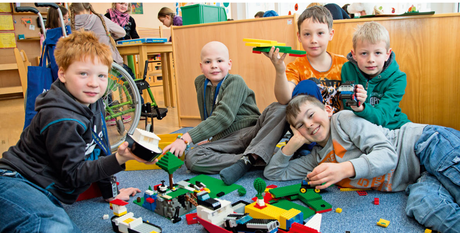
Die Hauptzeit des Tages verbringen die Geschwisterkinder in der Kinder- oder Jugendgruppe sowie in der Klinikschule.