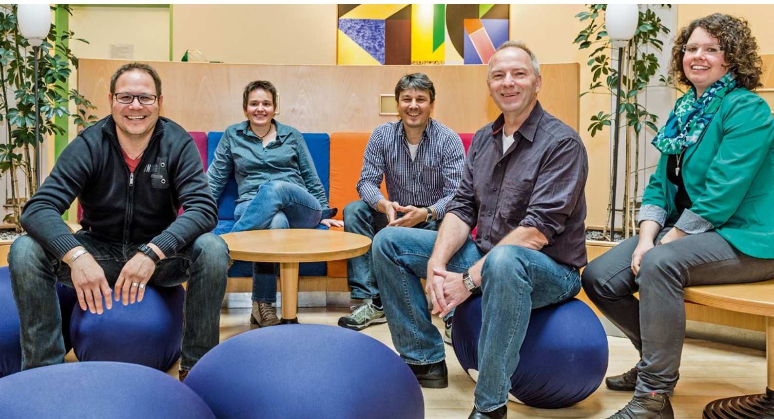
Unser Team der Rehabilitation für Verwaiste Familien.