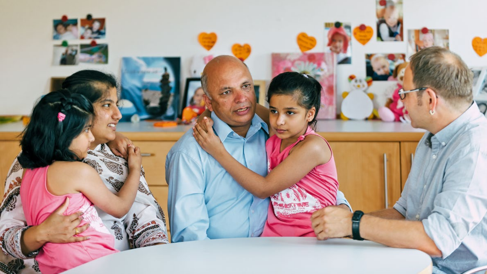
Professionelle Hilfe bei der Trauerbewältigung erhalten – Im Gespräch mit erfahrenen TherapeutInnen.

kümmern. Sie sind häufig auf soziale Unterstützung in ganz alltäglichen Verrichtungen angewiesen und haben kein geschütztes Familienleben mehr. Trotz aller Belastungen bedeutet diese intensive Zeit aber auch, dass die Familien ihr Kind beim Sterben begleiten und sich mit dem bevorstehenden Tod auseinandersetzen konnten oder mussten. Der Trauerprozess setzt hier schon früher ein als am Todestag des Kindes, ob bewusst oder eher unbewusst.