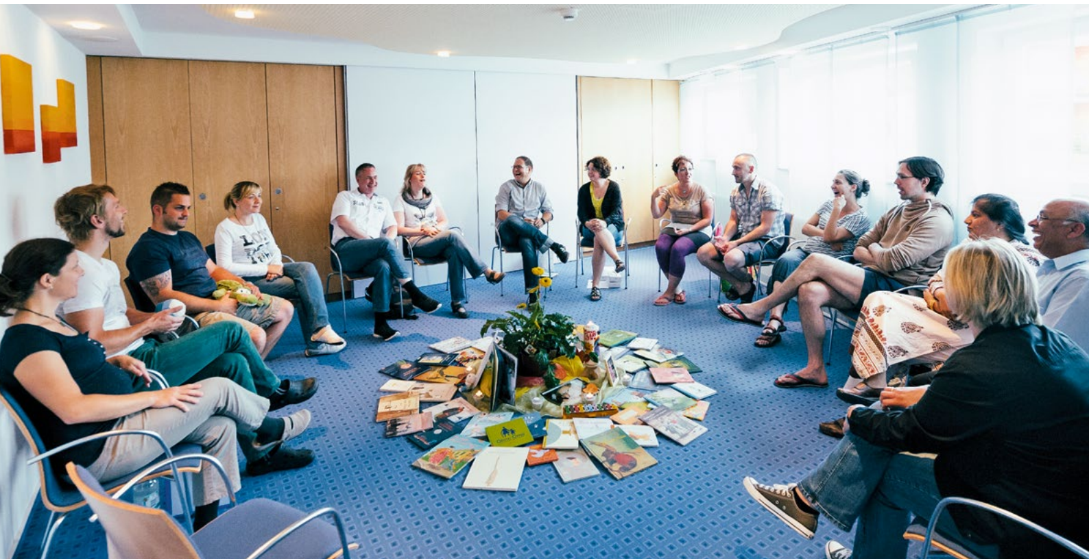
In der Gruppe ist Raum für Trauer und Gespräche – aber auch zum gemeinsamen Lachen und Freizeit gestalten.

ist gleichzeitig durch die Trauer emotional sehr gebunden. Die Familie als Ganzes muss ein neues Gleichgewicht entwickeln und dabei die Bedürfnisse, Fähigkeiten und Ressourcen jedes einzelnen Mitgliedes integrieren. Teilweise fallen Elternteile aufgrund der eigenen Trauer als stabile Elemente des Systems vorübergehend aus und der Partner/die Partnerin oder ein Kind übernehmen dessen Aufgaben.