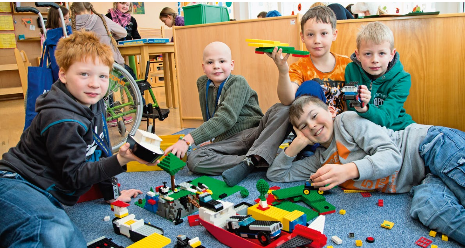
Die Hauptzeit des Tages verbringen die Geschwisterkinder in der Kinder- oder Jugendgruppe sowie in der Klinikschule.

ihr Bedürfnis, das Erlebte zu kommunizieren und Rückmeldungen von anderen Betroffenen zu bekommen. Die Gruppensitzungen werden von den Geschlechtern entsprechenden Therapeuten begleitet.