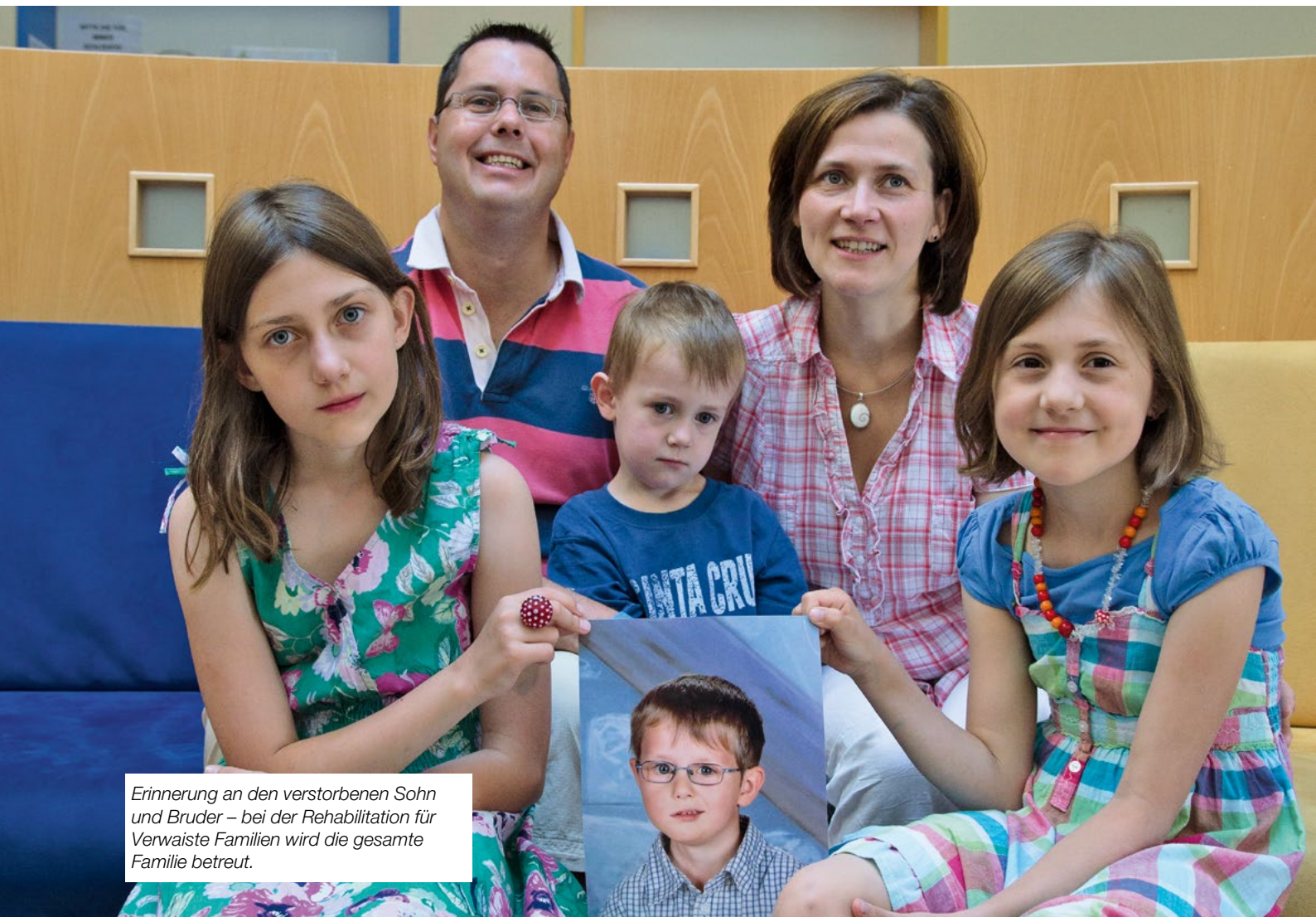
Erinnerung an den verstorbenen Sohn und Bruder – bei der Rehabilitation für Verwaiste Familien wird die gesamte Familie betreut.

Neben der emotionalen Gebundenheit der Eltern stellt auch die Unsicherheit im Umgang mit dem Thema Tod und Trauer im allgemeinen und speziell im Zusammenhang mit Kindern eine große Schwierigkeit dar. Wie viel eigene Trauer, Hilflosigkeit und Wut kann ich dem Kind zumuten? Wie viel und mit welchen Worten soll ich mit meinem Kind über Tod und Trauer sprechen? Inwiefern soll ich mein Kind an der Pla-