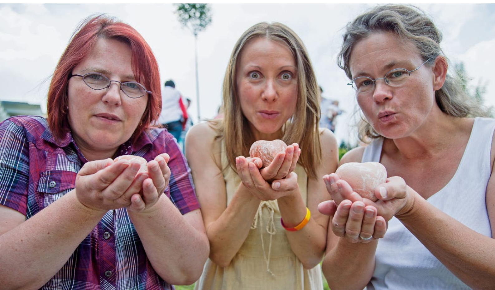
Herzenswünsche zum Himmel hoch schicken – Trauer wird nur durch Trauern besser.