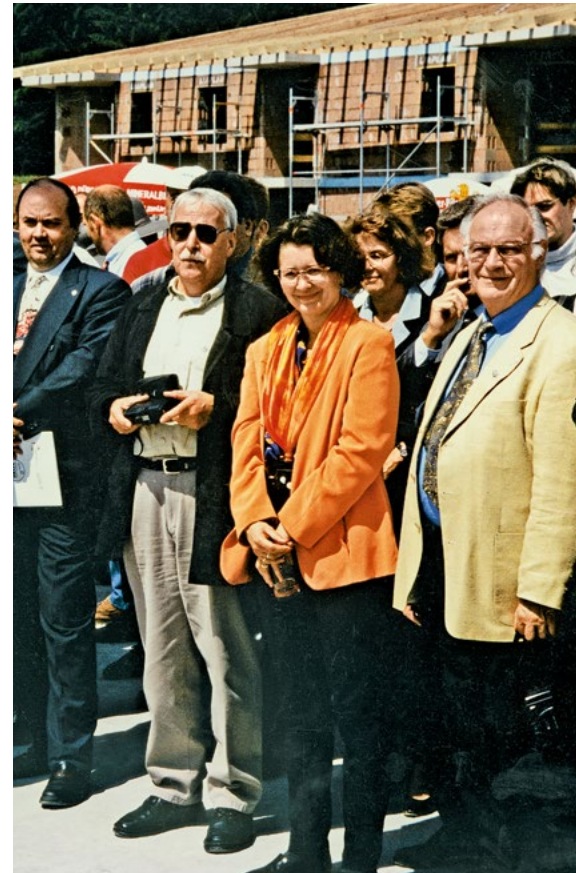
Finanzminister Gerhard Mayer-Vorfelder (Bild links, rechts) beglückwünschte die Initiatoren bei der Grundsteinlegung zur Nachsorgeklinik Tannheim im Namen des Landes Baden-Württemberg zum Baustart. Der Finanzminister hatte sich dafür persönlich eingesetzt. Bild rechts, rechts: Tannheim-Architekt Guido Rebholz.