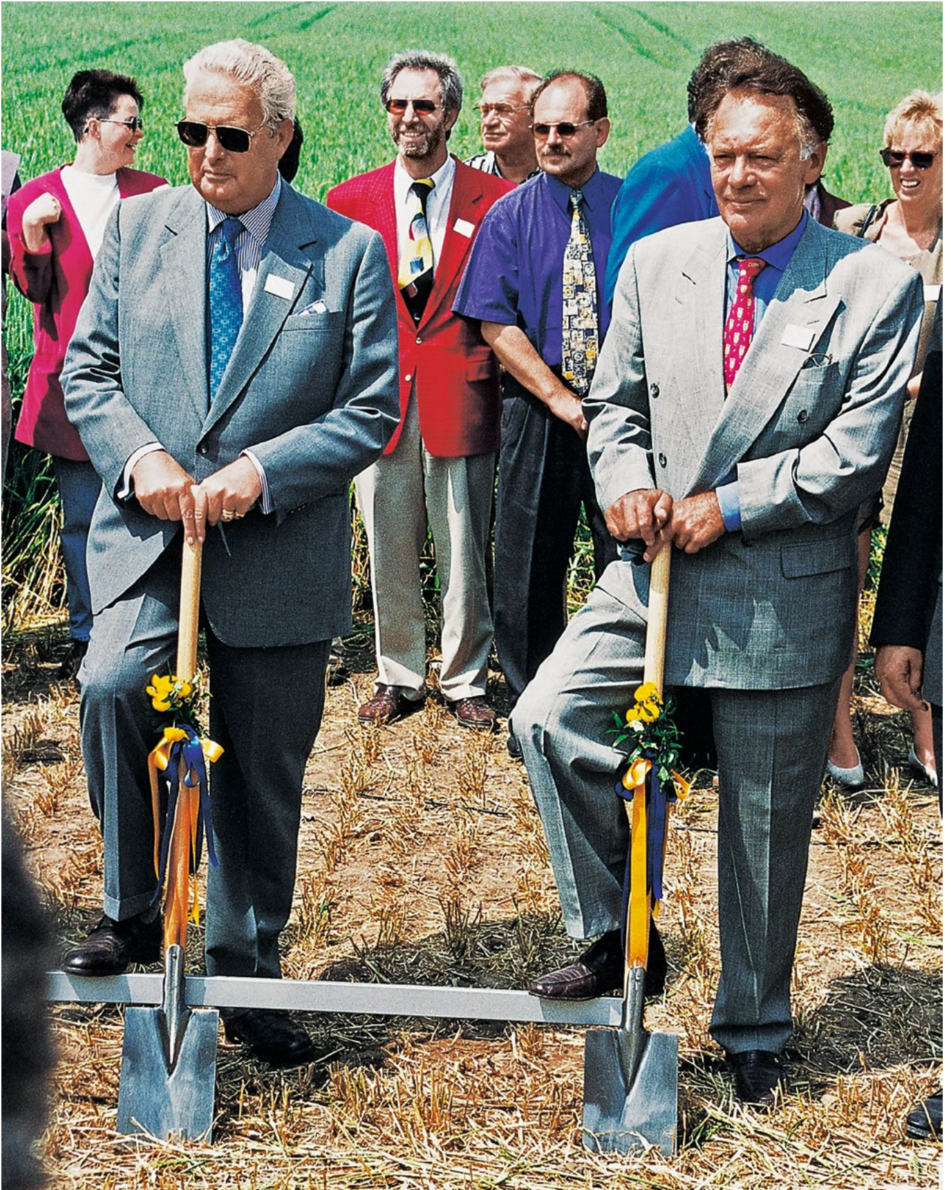
Erster Spatenstich zum Bau der Nachsorgeklinik Tannheim am 6. Juli 1995. Links Carl Herzog von Württemberg, rechts Klausjürgen Wussow.